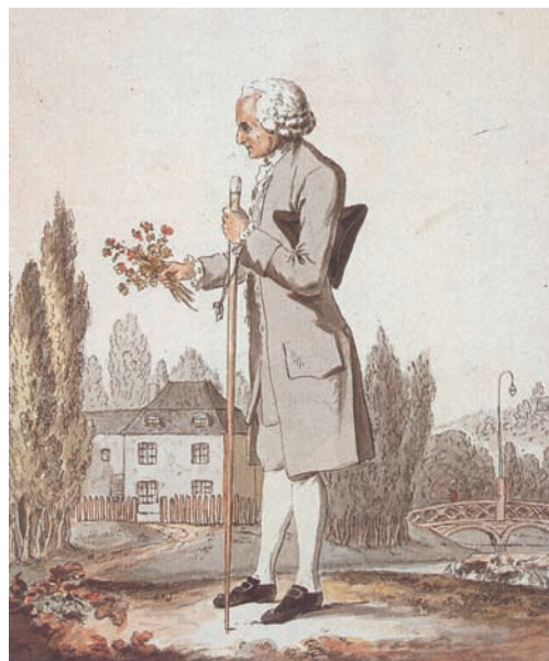
L'auteur des Confessions devant le pavillon qu'il habitait à Ermenonville.