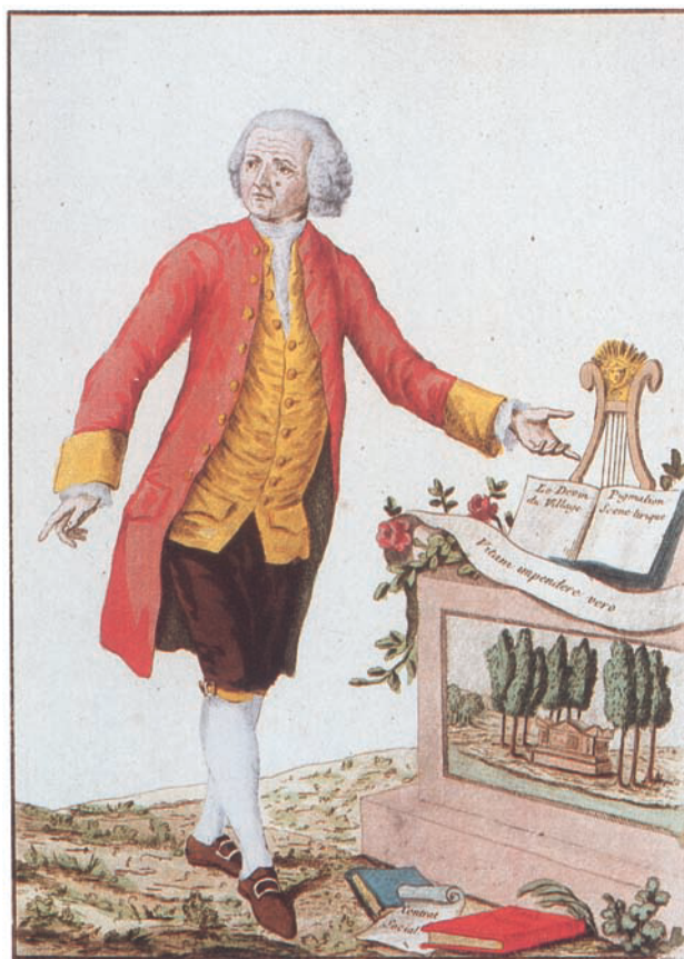
Âgé de 66 ans, Rousseau est représenté ici entouré de ses œuvres : Le Devin du village , Pygmalion , Le Contrat social et L'Émile .